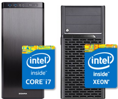
KRONOS 840-G3 Core i7-5960x (8コア、4.5GHz) KRONOS 940-G3 (デュアルソケット) Intel Xeon E5-2600 v3

オーバークロック済みのインテル® Core™ i7-5960X プロセッサ エクストリーム・エディションとインテル® X99 チップセット、そして高速な DDR4 メモリーを組み合わせた製品とインテル® Xeon プロセッサをアップクロックしたデュアルソケットで大容量メモリの搭載が可能なモデルをご用意しています。